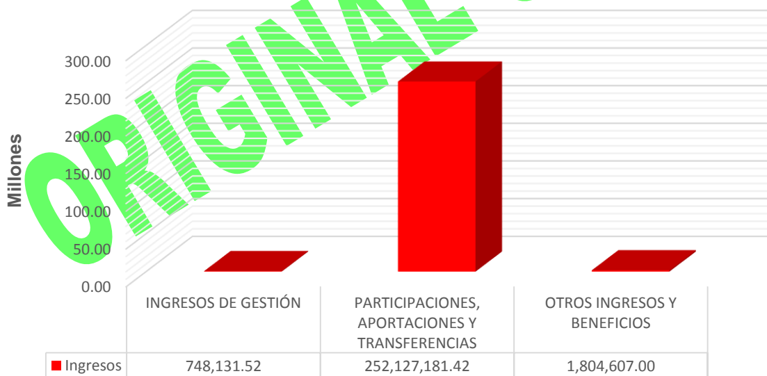
GRÁFICA 1 INGRESOS